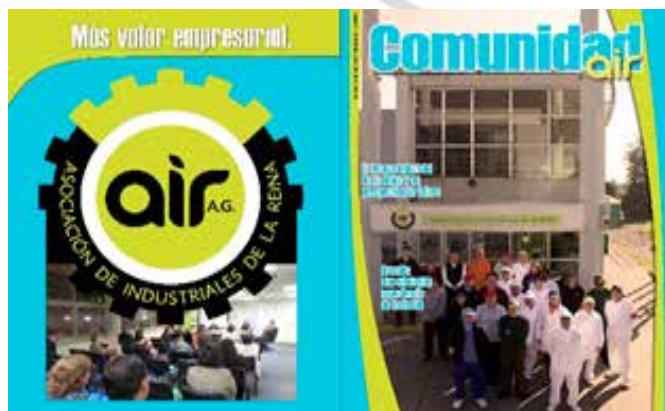
Edición N°1 Comunidad AIR: