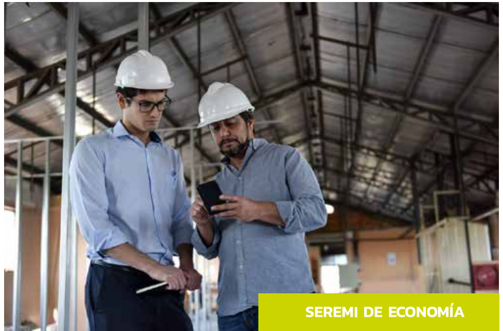
SEREMI DE ECONOMÍA