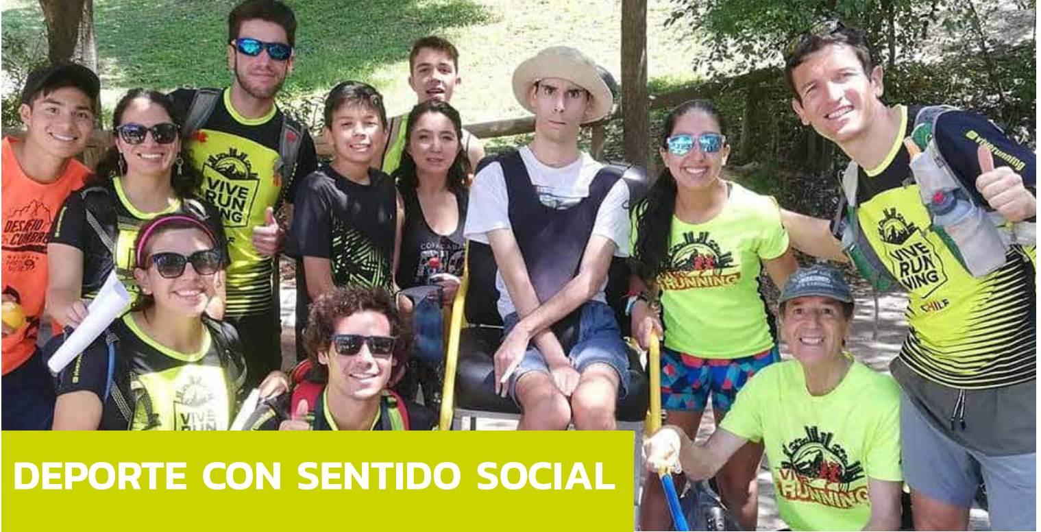
DEPORTE CON SENTIDO SOCIAL